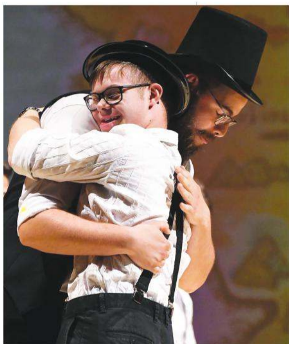
Il progetto "Teatro" di Abil-mente.

Referente dei progetti di Vicenza 339 4424799